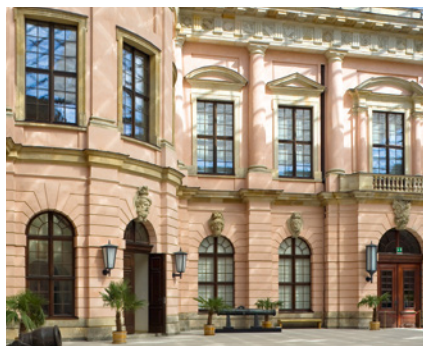
Deutsches Historisches Museum, Berlin, Deutschland