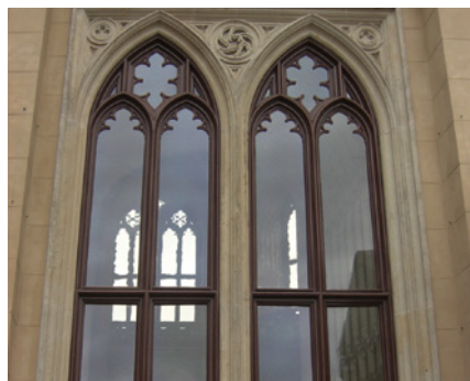
Schloss Babelsberg, Babelsberg, Deutschland