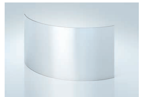
ROBAX®-keraaminen lasi | kaareva