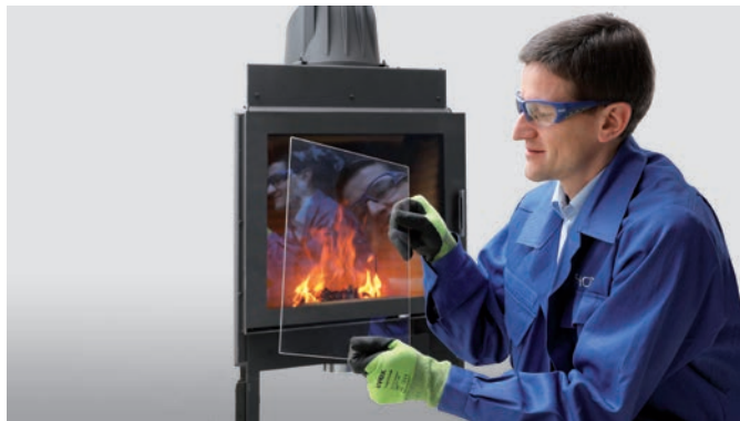
Feuersichtscheibe mit wärmereflektierender Beschichtung IR Max

Unsere beste wärmereflektierende Beschichtung