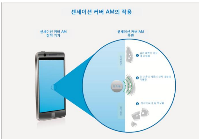
설명: Xensation® Cover AM의 작용

인쇄용 사진 압축파일 다운 사이트: http://www.schott-pictures.net/presskit/209875.AM