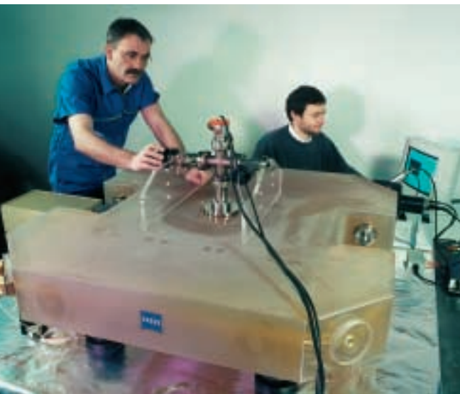
In Neuseeland wurde das Messprinzip des Ringlasers mit einem bei Zeiss auf der Basis von „Zerodur“ hergestellten Prototyp erfolgreich getestet.

Die Forscher in Neuseeland verfügten bereits über ein Höhlenlabor mit der notwendigen Infrastruktur – ausreichend für die angestrebten Testzwecke mit dem „Zerodur“ Block, der dafür rund um den Globus verschifft wurde. Der Erfolg gab der Mühe Recht: „Wie wir schon vorher wussten, war der Sagnac-Effekt bei diesem Ringlaser zu gering, um Schwankungen der Tageslänge nachzuweisen. Wir konnten aber die erhofften Erkenntnisse darüber gewinnen, wie sich die Verstärkung des