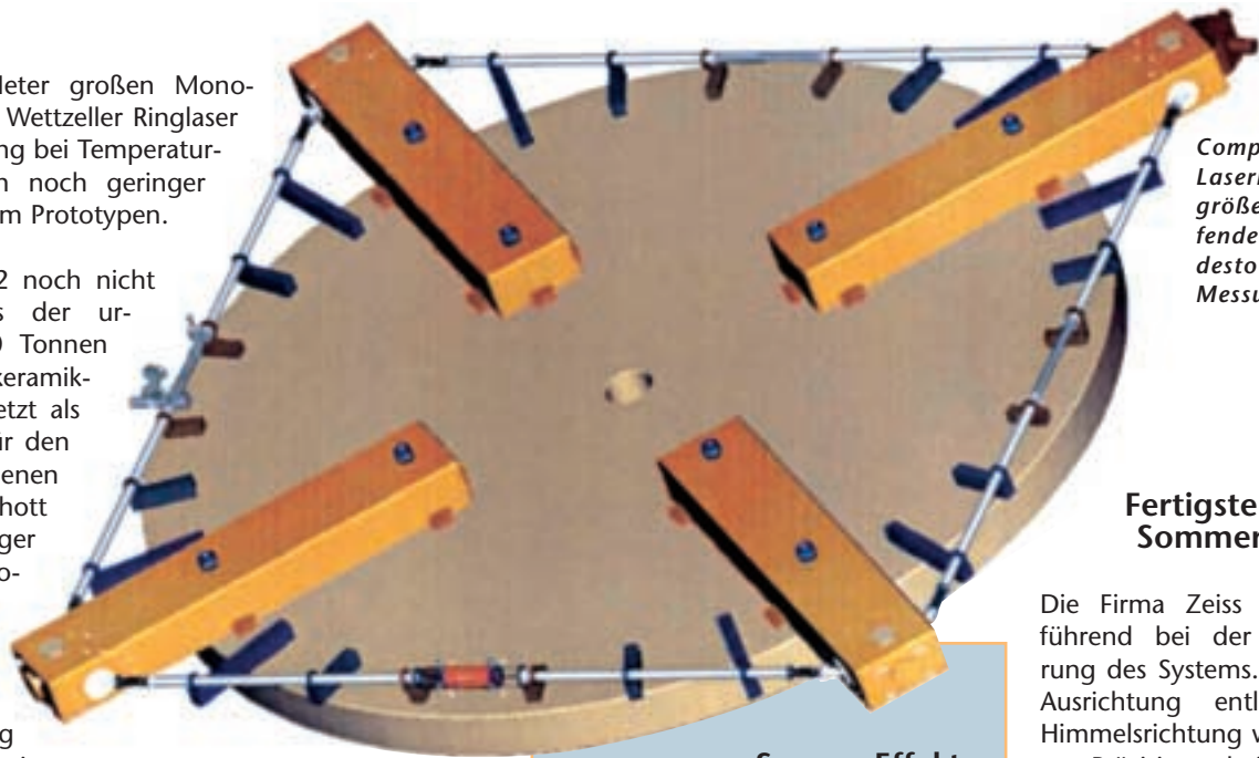
Computergrafik des Laserkreisels: je größer der umlaufende Strahlengang, desto genauer die Messung.

Das war 1992 noch nicht absehbar, als der ursprünglich 20 Tonnen schwere Glaskeramik-Block – der jetzt als Grundstock für den Ringlaser dienen sollte – bei Schott als Spiegelträger für die Astronomie gegossen wurde. Doppelte Umsicht und Vorbereitung bei jedem Fertigungsschritt waren deshalb gefragt. Die Rohscheibe wurde zunächst in zwei Hälften geschnitten – eine Prozedur von einer Woche – und unter ständigen Qualitätsmessungen in seine jetzige Form gebracht. Um die Temperaturexpansion auf ein Fünftel des bisherigen „Zerodur“ Werts zu bringen, erhielt der Rohling eine zusätzliche Wärmebehandlung – Nachkeramisierung genannt – die drei Monate in Anspruch nahm. Als Resultat dieser Behandlung dehnt sich der Block jetzt bei Temperaturschwankungen um ein Kelvin lediglich noch um 60 Milliardstel Meter aus.