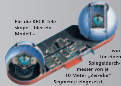
Für die KECK-Teleskope – hier ein Modell –