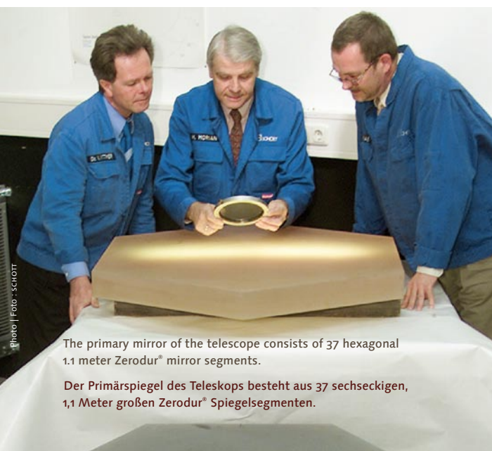
The primary mirror of the telescope consists of 37 hexagonal 1.1 meter Zerodur® mirror segments.

Eines scheint sicher: LAMOST wird die Erfolgsgeschichte der großen Himmeldurchmusterungen wie etwa des Sloan Digital Sky Survey (SDSS) erweitern und vertiefen. Die mit LAMOST aufgenommenen, vielen Millionen optischer Spektren werden für die beobachtende Kosmologie, für die Erforschung der Entstehung und Entwicklung von Galaxien und der Struktur des Milchstraßensystems sowie für die stellare Astrophysik eine neue Grundlage schaffen. <| thorsten.doehring@schott.com