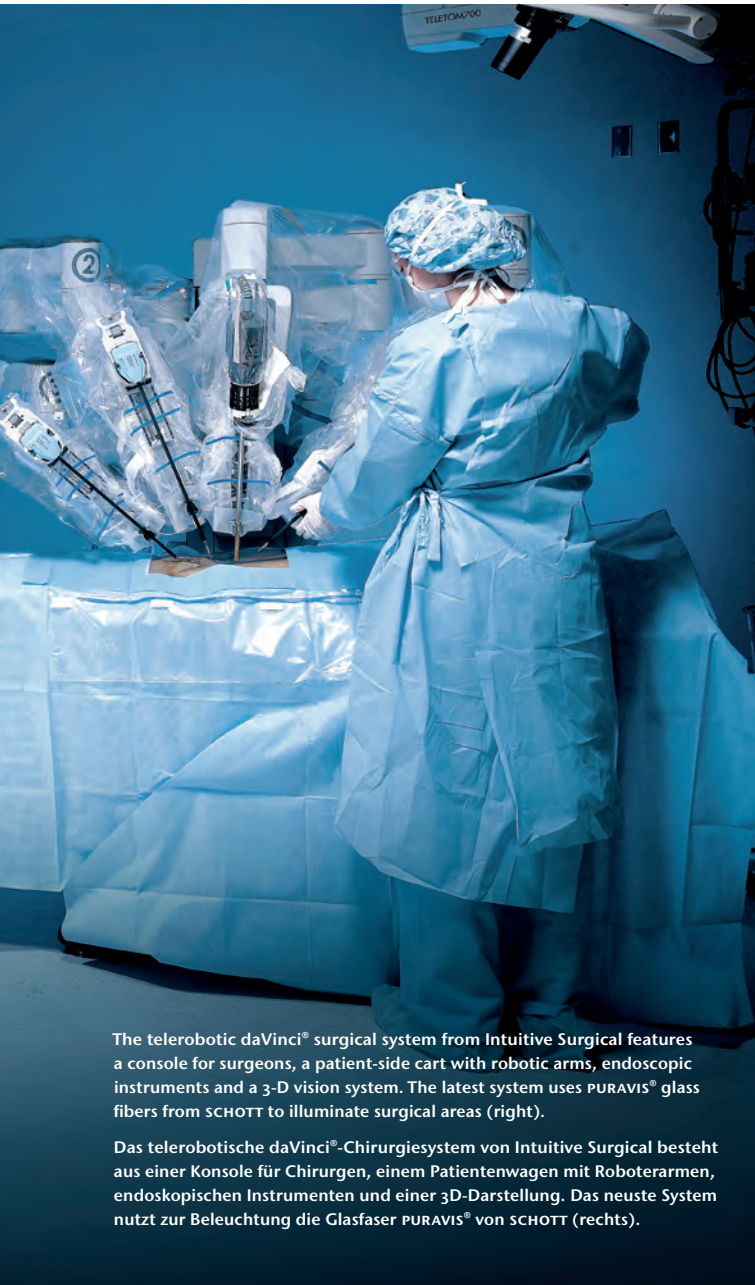
The telerobotic daVinci® surgical system from Intuitive Surgical features a console for surgeons, a patient-side cart with robotic arms, endoscopic instruments and a 3-D vision system. The latest system uses PURAVIS® glass fibers from SCHOTT to illuminate surgical areas (right).