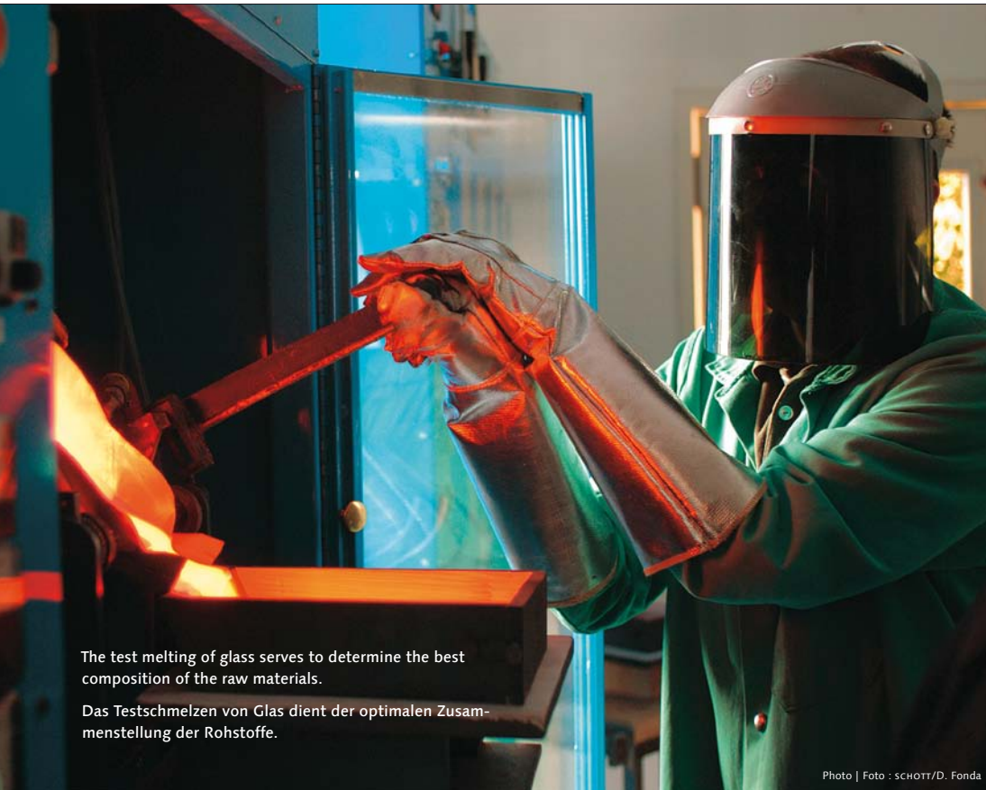
The test melting of glass serves to determine the best composition of the raw materials.