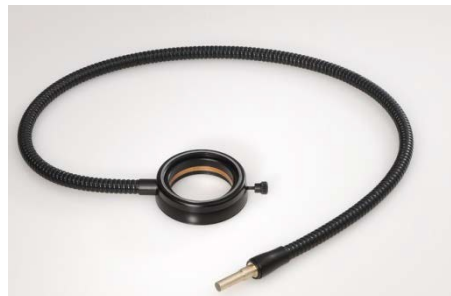
アニュラリングライト66mm