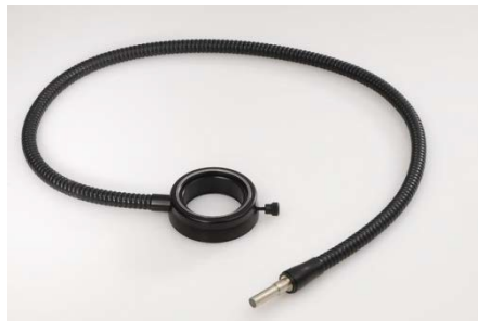
アニュラリングライト58mm