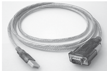
コンバータケーブル