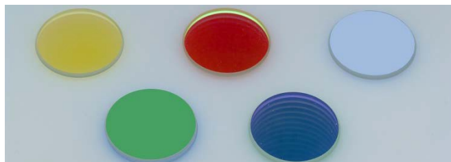
KL 1600LED、KL2500LED、 KL1500HAL、KL2500LCD用インサートフィルタ