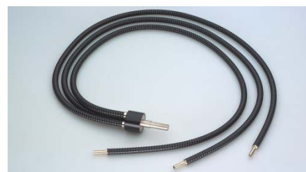
フレキシブルライトガイド(2分岐)