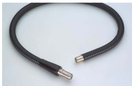
KL 2500 LCD用フレキシブルライトガイド