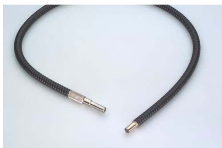
フレキシブルライトガイドシングル