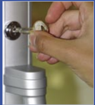
Les portes peuvent être livrées avec ou sans serrure.