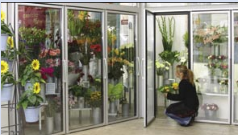
Roll In - pour que la lumière éclaire les fleurs au mieux.

Roll In – la solution pratique pour les chambres froides à usage commercial.