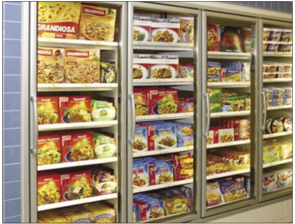
T66 LT, OK/Q8 Huddinge. Une marchandise bien présentée contribue à augmenter la vente.

L'éventail d'utilisation de nos portes vitrées est extrêmement large et assure par exemple la préservation parfaite des flacons de sang.