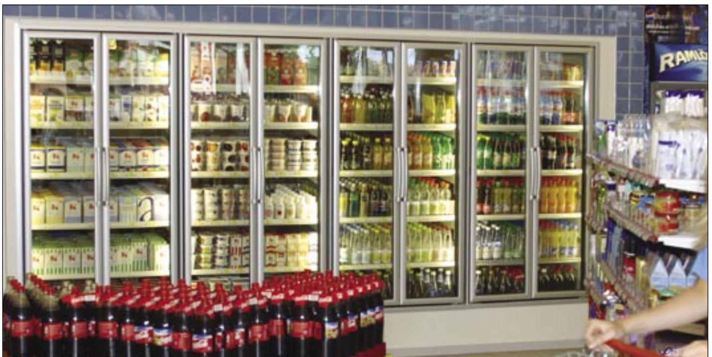
T45 NT Maxi Twin. Idéale pour les magasins d'une surface de vente de taille moyenne.

en utilisant toute la contenance de la chambre froide. Même ouvertes, les portes ne font pas obstacle. Les portes sont adaptées aux modules des chariots de laiterie (45 cm).