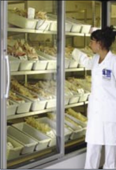
T76 NT, banque de sang, Hôpital Huddinge. Nos portes vitrées répondent aux exigences de qualité les plus élevées.

L'éventail d'utilisation de nos portes vitrées est extrêmement large et assure par exemple la préservation parfaite des flacons de sang.