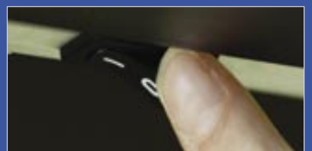
Le chauffage du cadre peut être allumé ou éteint manuellement.