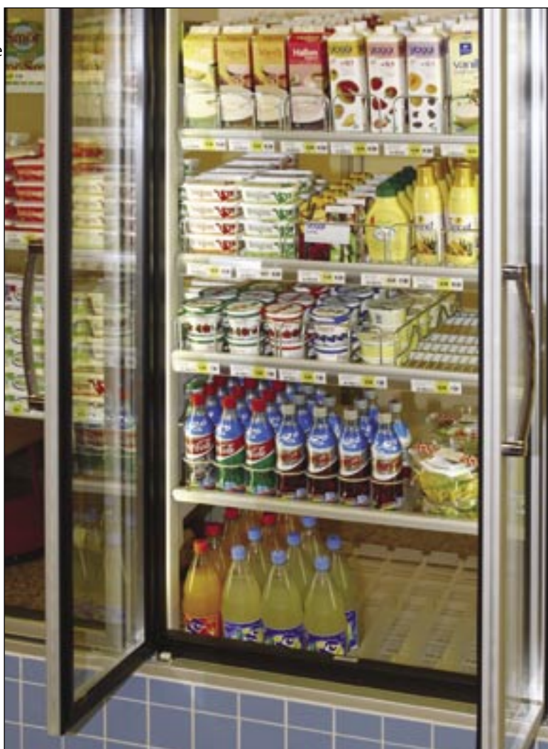
Toute marchandise quelle que soit sa taille entre dans notre système de rayonnage.