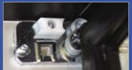
L'arrêt de porte facilite l'approvisionnement et le nettoyage.