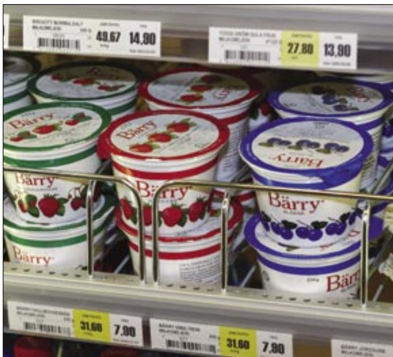
Un autre avantage de Flexi Shelf Pro – tous les composants sont ajustables aux tailles différentes de vos produits.

Le système ne contient que deux montants installés à l'avant afin de faciliter le nettoyage et le réapprovisionnement des étagères.