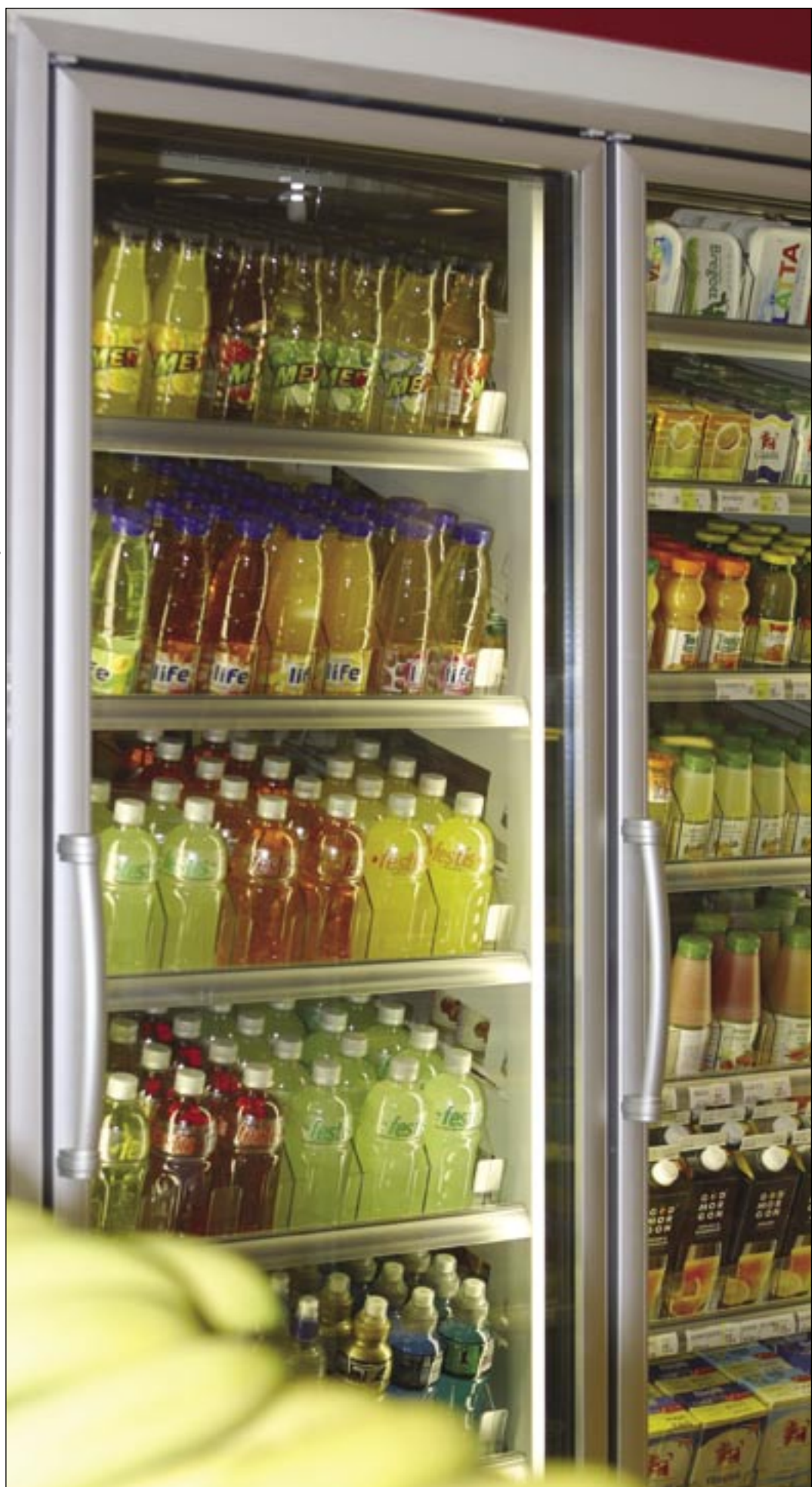
T66 NT, 7-Eleven, Arlanda. Présentation élégante et efficace de la marchandise.

LT = Température basse, congélation, à -25°C