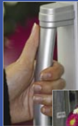
Des poignées élégantes et solides.