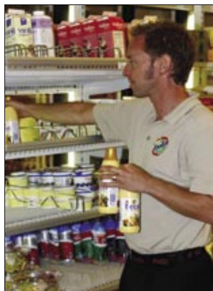
Approvisionnement et nettoyage de la chambre froide – rapide et simple avec les étagères montées à l'avant.