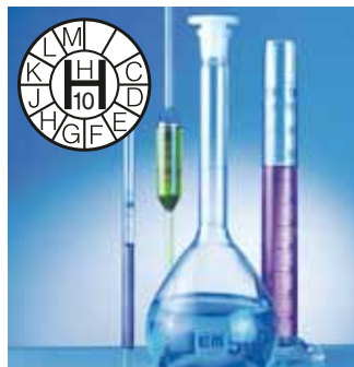
Appareils volumétriques en verre