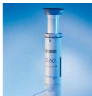
Appareil de dosage ceramus-classic