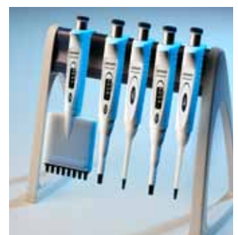
Pipettes à matelas d'air