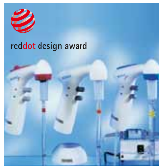
Appareils de pipetage

HOTLINE +49 (0) 7134 511-0 Le moyen le plus rapide d'accéder à un entretien profitable avec un spécialiste.