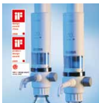
Appareil de titrage / de dosage motorisé à commande électronique