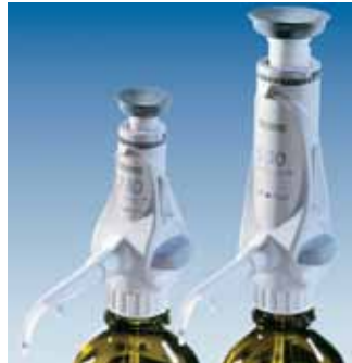
Appareils de dosage avec système de recirculation

Technologie intelligente et fabrication des plus modernes pour une qualité et une fiabilité optimales.