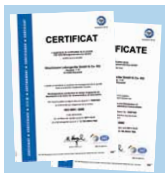
Certificats ISO 9001