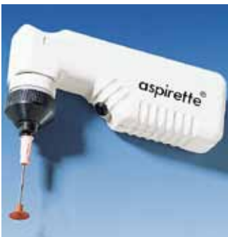
Pince à vide