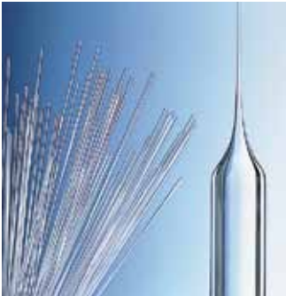
Technique des capillaires