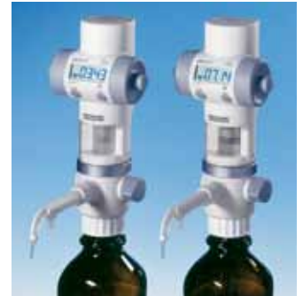
Titrage avec énergie solaire

Technologie intelligente et fabrication des plus modernes pour une qualité et une fiabilité optimales.