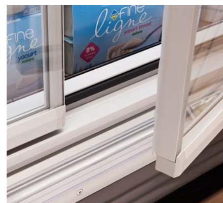
SCHOTT Termofrost® AGD 3