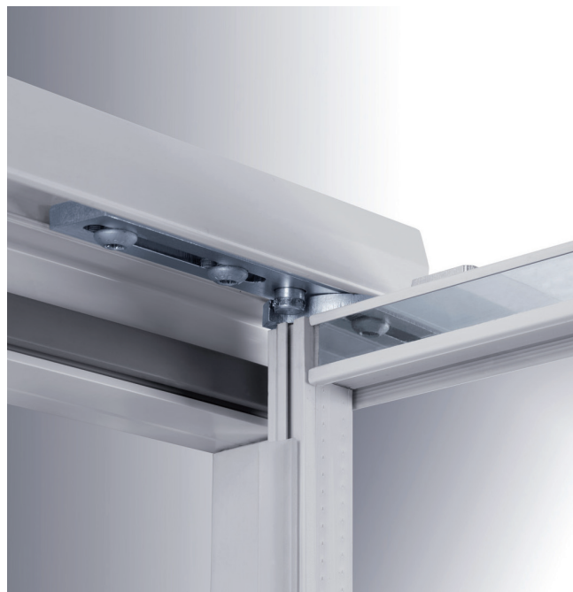
La funzione ferma-porta mantiene l'anta aperta.