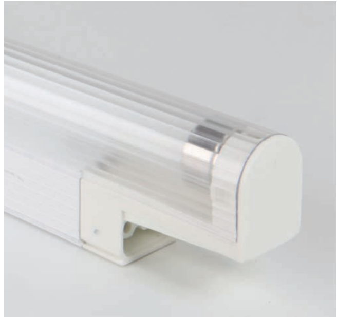
Illuminazione a tubo fluorescente.