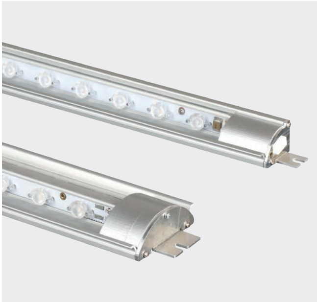
Diverse opzioni di illuminazione a LED.