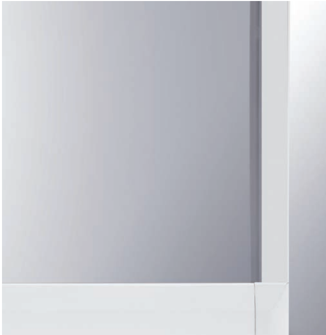
Area espositiva extra grande.