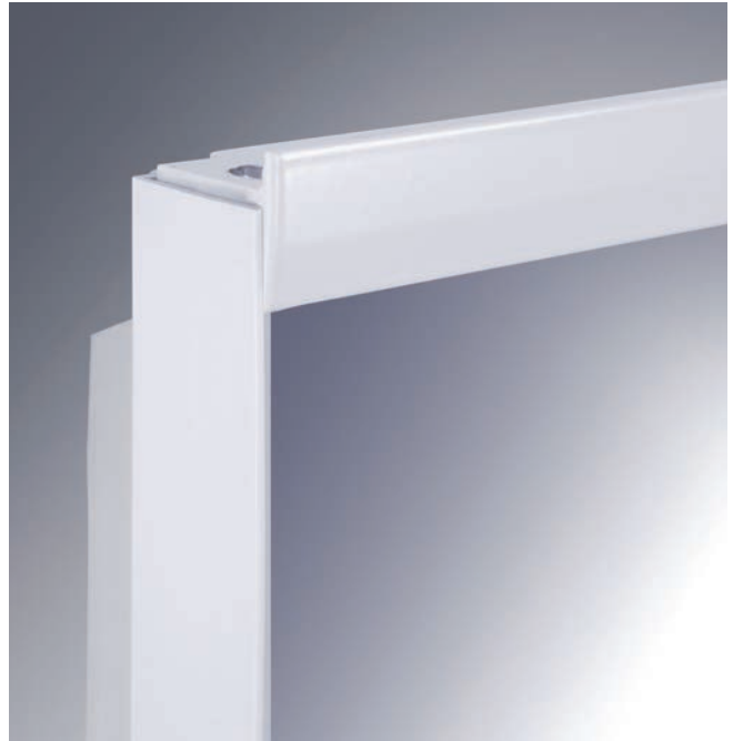
Profilo superiore e inferiore in colore grigio chiaro.