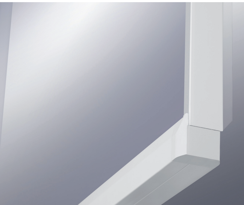
La protezione sottile sul bordo protegge il vetro e migliora la visibilità.