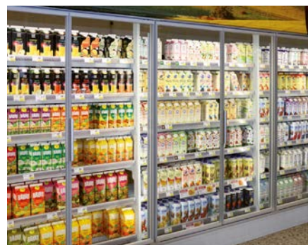
SCHOTT Termofrost® CRS View: schmale Rahmenprofile für eine verbesserte Sichtbarkeit

Zwei Farben stehen zur Auswahl. Außerdem ist das System in zwei Höhen erhältlich: Höhen für die Installation auf einem Sockel und Walk-in für die bodentiefe Installation. Der Installationsaufwand des Systems ist nur minimal, da Türen und Rahmen vorinstalliert geliefert werden.