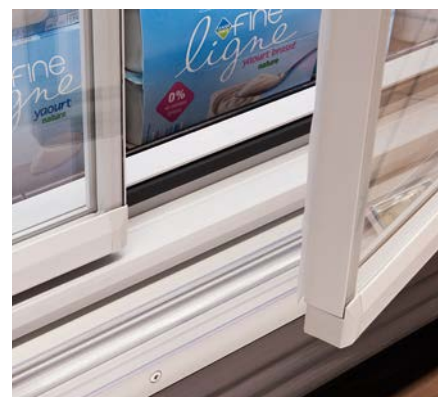
SCHOTT Termofrost® AGD 3