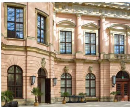
Deutsches Historisches Museum, Berlin, Deutschland