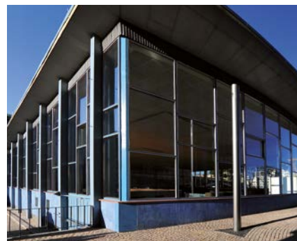
Tränenpalast, Berlin, Deutschland