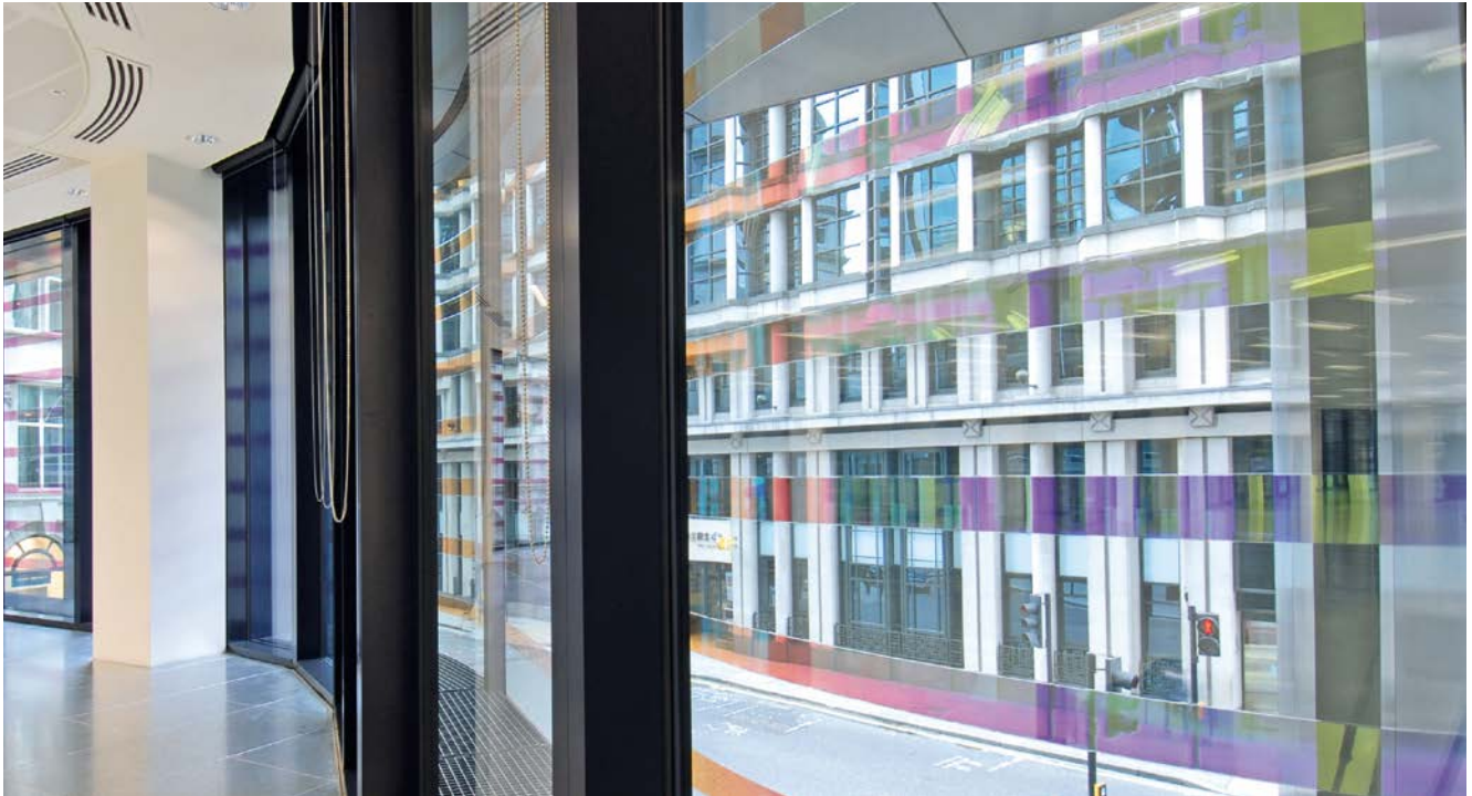
Faszinierender Ausblick: NARIMA® im Bürohaus „60 Threadneedle Street“, London Architektur: Eric Parry Architects