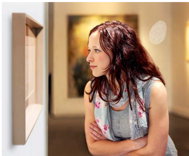
SCHOTT MIROGARD® DARO permet un encadrement pictural sur lequel les traces de doigt et la saleté n'ont pas leur place.

mais aussi l'excellente protection du traitement DARO contre la saleté. Ce sont toutes les caractéristiques qui ont la plus grande importance pour les musées, les galeries d'art, expositions etc.