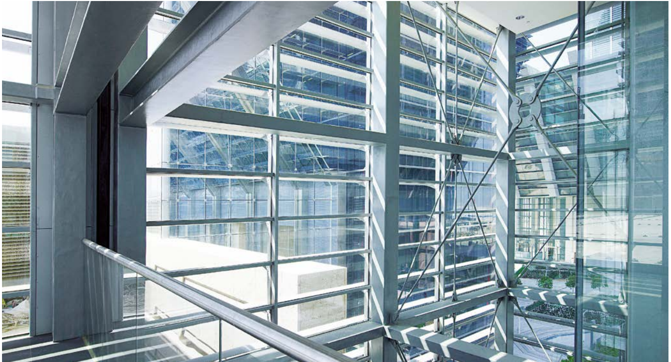
アブダビ・ファイナンシャル・カー・パークのファサードに採用されている反射防止ガラス