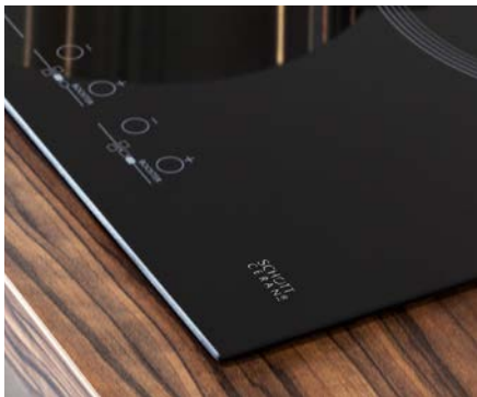
为家用电器行业提供创新解决方案