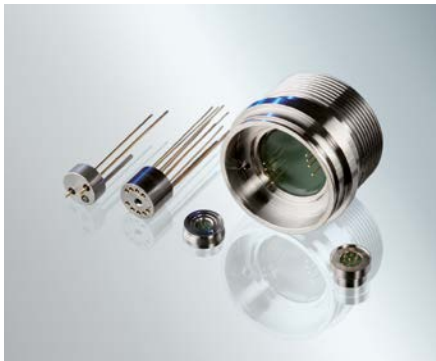
为各种灵敏电子产品提供长期、可靠的保护