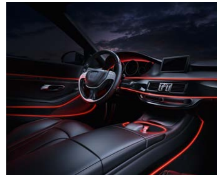
汽车内饰照明解决方案