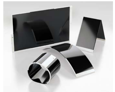
高强度超薄玻璃在移动设备中应用前景广阔