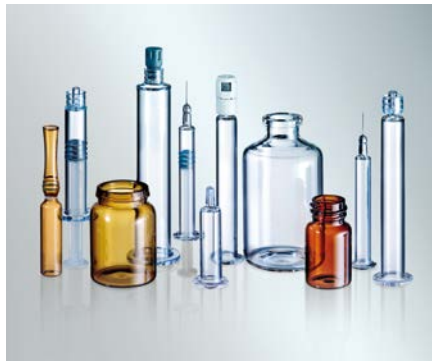
为医药包装提供安全、可靠、优质的保障