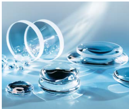
为精密光学应用提供高品质的材料与元件