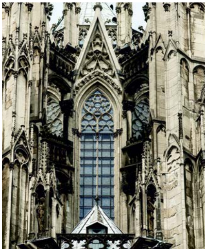
SCHOTT AMIRAN® Heritage Protect

Im Frühjahr 2018 erhielt das erste Chorobergadenfenster am Kölner Dom die neue Schutzverglasung SCHOTT AMIRAN® Heritage Protect. Weitere Fenster sollen folgen.