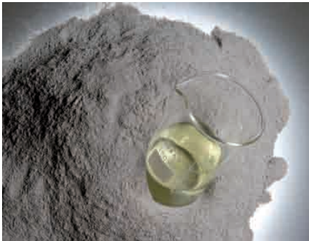
Die Komponenten des Polysilikatklebers