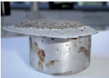
Haftzugfestigkeit im Test: Nach 56 Frost/Tau-Wechseln versagt das Glas/Polysilikat/Beton-Verbundsystem durch Abriss im Beton erst bei über 3,5 N/mm 2 .

Wissenschaftler des Fachbereichs „Baustoffe und Baustoffprüfung“ an der Technischen Universität Berlin haben ein neues Verfahren zum Schutz von Bauwerk- und Bauteiloberflächen entwickelt. Das KONUTEKT® Glass Lining System besteht aus einem biegsamen Borosilikat-Dünnglas, das zusammen mit einem mineralischen Kleber einen dauerhaften Schutz für chemisch stark beanspruchte Bauwerkoberflächen bildet. Das Glas kann durch seine geringe Dicke und Flexibilität überlappend verlegt werden, so dass keine Fugen entstehen. In Zusammenarbeit mit der MC-Bauchemie, Bottrop, ist aus der Entwicklung ein marktreifes Produkt entstanden.