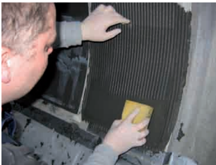
Gleichmäßiges Aufbringen des Klebers Auflegen des Borosilikat-Dünnglases Blasenfreies Andrücken der Glasplatten