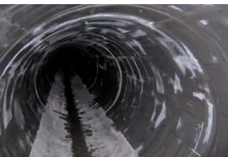
Mit Borosilikat-Dünnglas fugenlos überlappend beschichtete Betonrohre DN 1600 im Schwarzbachkanal