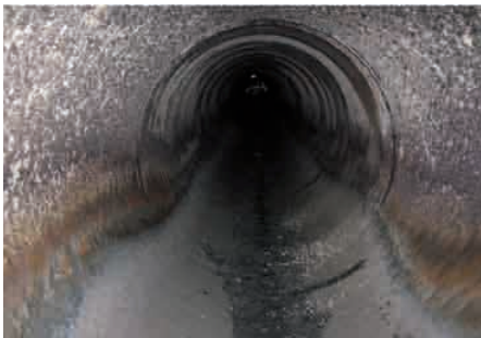
Herkömmliche Abwasserbetonrohre von Biogener Schwefelsäure Korrosion befallen

Wertvolles bewahrt man hinter Glas auf. Glasvitriolen schützen kostbare Juwelen und viele unersetzliche Meisterwerke werden durch entspiegeltes Glas vor Säureangriffen geschützt. Beton an sich scheint nur auf den ersten Blick nicht wertvoll. Mit seiner massenhaften Anwendung jedoch werden Werte geschaffen, die in vielen Fällen ebenfalls einen besonderen Schutz benötigen.