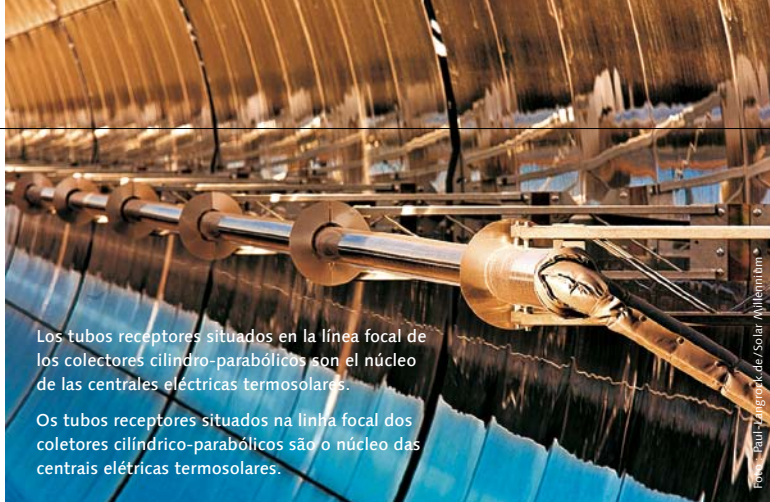
Los tubos receptores situados en la línea focal de los colectores cilindro-parabólicos son el núcleo de las centrales eléctricas termosolares.

Actualmente la cuestión no es si esta idea, que hace sólo unos años era considerada utópica o un espejismo de política energética, es realizable, sino cómo. Hoy en día nadie pone en duda que básicamente es viable, en parte debido a los considerables conocimientos expertos que las compañías fundadoras atesoran en las áreas financiera y tecnológica. Las inversiones totales se estiman en aprox. 400 millardos de € hasta 2050; se trata de una suma enorme, que sin embargo se reparte entre numerosas áreas de desarrollo y fases de proyecto distintas. Se van a beneficiar