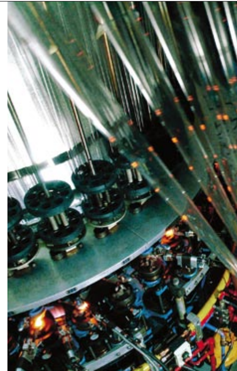
Fiolax® glass tubing is used to make advanced pharmaceutical packaging. SCHOTT-Rohrglas GmbH is the world's first tubing company to be certified according to ISO 15378.

Nicht nur die Produktion, auch die Verpackung unterliegt höchsten Qualitätsansprüchen, sie wird bei „TopLine“-Produkten ausschließlich in der Reinraumklasse 100.000 durchgeführt. Dadurch wird die Konzentration an Partikeln in der Luft reduziert. Auch Temperatur, Luftfeuchtigkeit und Druck werden nach vorgegebenen Parametern gesteuert. Dies ent-