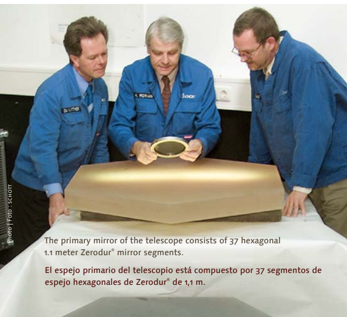
The primary mirror of the telescope consists of 37 hexagonal 1.1 meter Zerodur® mirror segments.

El espejo primario del telescopio está compuesto por 37 segmentos de espejo hexagonales de Zerodur® de 1,1 m.