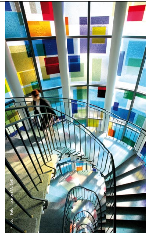
Thin-film modules were integrated into this staircase designed with Artista® colored glass.

In der weitestgehend automatisierten High-Tech-Produktion werden Solar-Dünnschichtmodule mit einer jährlichen Kapazität von 33 MW gefertigt.