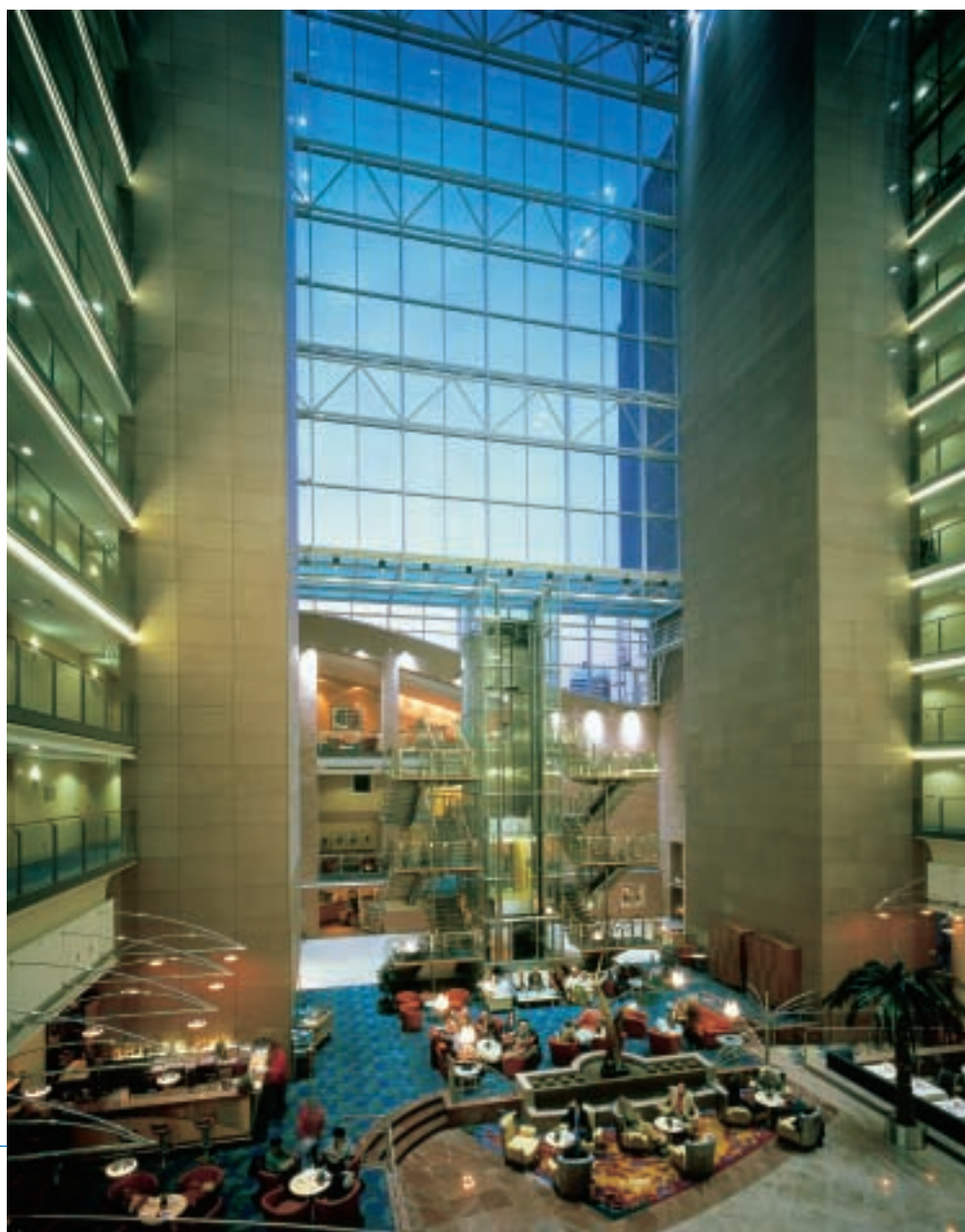
Blickfang des Hotels ist das großzügige Atrium, das sich 45 Meter hoch bis zum First erhebt.