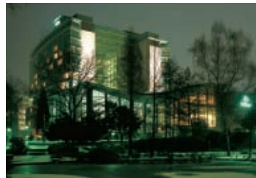
Das neue Hilton liegt im Zentrum Frankfurts, unweit von Börse, Alter Oper und Bankenviertel.

Atrium wie ein Kamin. Sollte es im Foyer brennen, muss der Fluchtweg auch in den oberen Etagen sichergestellt sein. Bis zum siebten Obergeschoss sind diese Flure offen; sie werden im Brandfall durch Rauchgasschürzen geschützt, die aus der abgehängten Decke gefahren werden. Ab dem achten Obergeschoss sind die Flure mit einer G-30-Verglasung voll verglast. Diese Brandschutzverglasungen verhindern den Flammen- und Brandgasdurchtritt für mindestens 30 Minuten. Bei den Fenstern der zum Atrium hin orientierten Gästezimmer in den unteren Etagen schützen die Verglasungen die Gästezimmer gegen Rauch- eintritt und Brandüberschlag von außen.