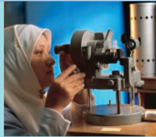
Digitale Projektion erfordert höchste Präzision in der Brechwertbestimmung.

Ein umfangreiches Weiterbildungsangebot erhöht die Qualifikation der Mitarbeiter.