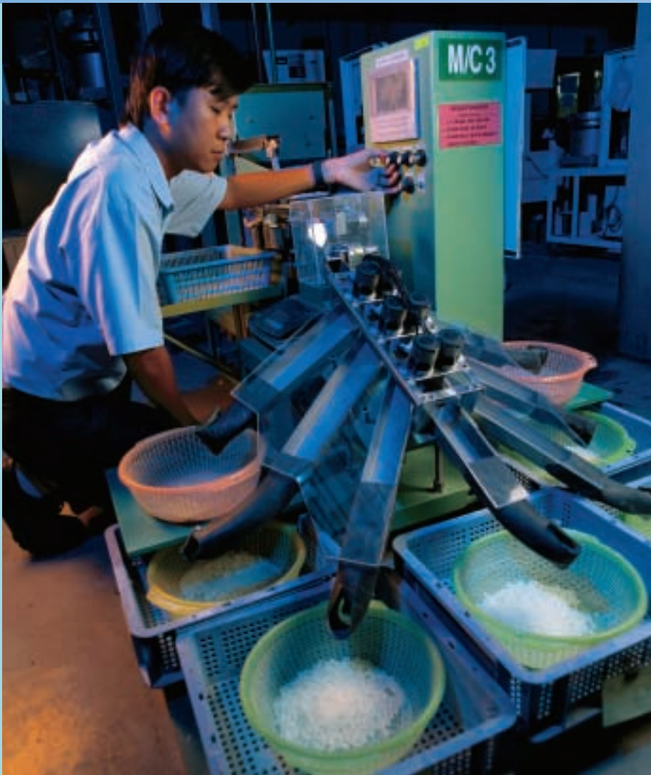
Würfelförmige Vorprodukte für Kleinlinsen werden vollautomatisch nach Gewicht sortiert.