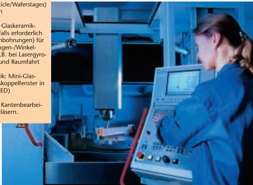
Herzstück des neuen Dienstleistungszentrums ist eine Fünf-Achs-Bearbeitungsanlage.

Neben der Fünf-Achs-Bearbeitungsanlage steht noch eine weitere Maschine im FBZ: Eine Wafersäge arbeitet mit einer Trennschleifscheibe und einer Hochfrequenzspindel, die sich mit 80.000 U/min dreht. Die über vier Achsen NC-gesteuerte Maschine ist zusätzlich mit einem Rundtisch ausgestattet und schleift Bauteile bis zu einer Größe von 200 x 200 x 3 Millimetern. Zum Feinschleifen planer Oberflächen wird eine Einseitenläppmaschine beschafft. Sie kann mit einem Pelletwerkzeug ausgestattet werden. Dieses Verfahren erlaubt im Vergleich zum kinematisch verwandten Läppen verbesserte Oberflächenqualitäten bei wesentlich höheren Abtragsraten. Neben der Bearbeitung komplexer Bauteile und der Prototypenherstellung dient das FBZ auch der Technologieentwicklung. Bisher sind die Entwicklungsmöglichkeiten vornehmlich auf neue Schleifverfahren oder Tests neuer Schleifwerkzeuge beschränkt. Zukünftig denkbar und auch geplant ist ein weiterer Ausbau, so dass ein Großteil der für Schott relevanten Nachverarbeitungstechnologien dort verfügbar ist ■