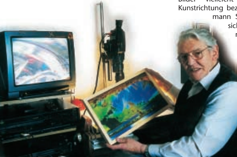
Bildet „Licht-Leben“ ab: Fotograf Hermann Schröder

Optisches Glas von Schott und Licht sind Hauptwerkstoffe des Künstlers Hermann Schröder, der mit seiner Fotokamera surreale Lichtwelten auf Zelluloid zaubert.