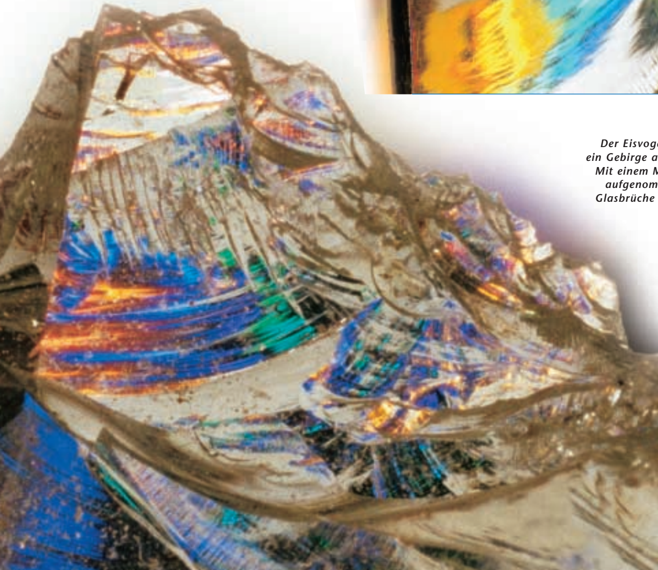
Der Eisvogel (oben) und ein Gebirge aus Eis (links): Mit einem Makroobjektiv aufgenommen erinnern Glasbrüche oft an naturnahe Motive.