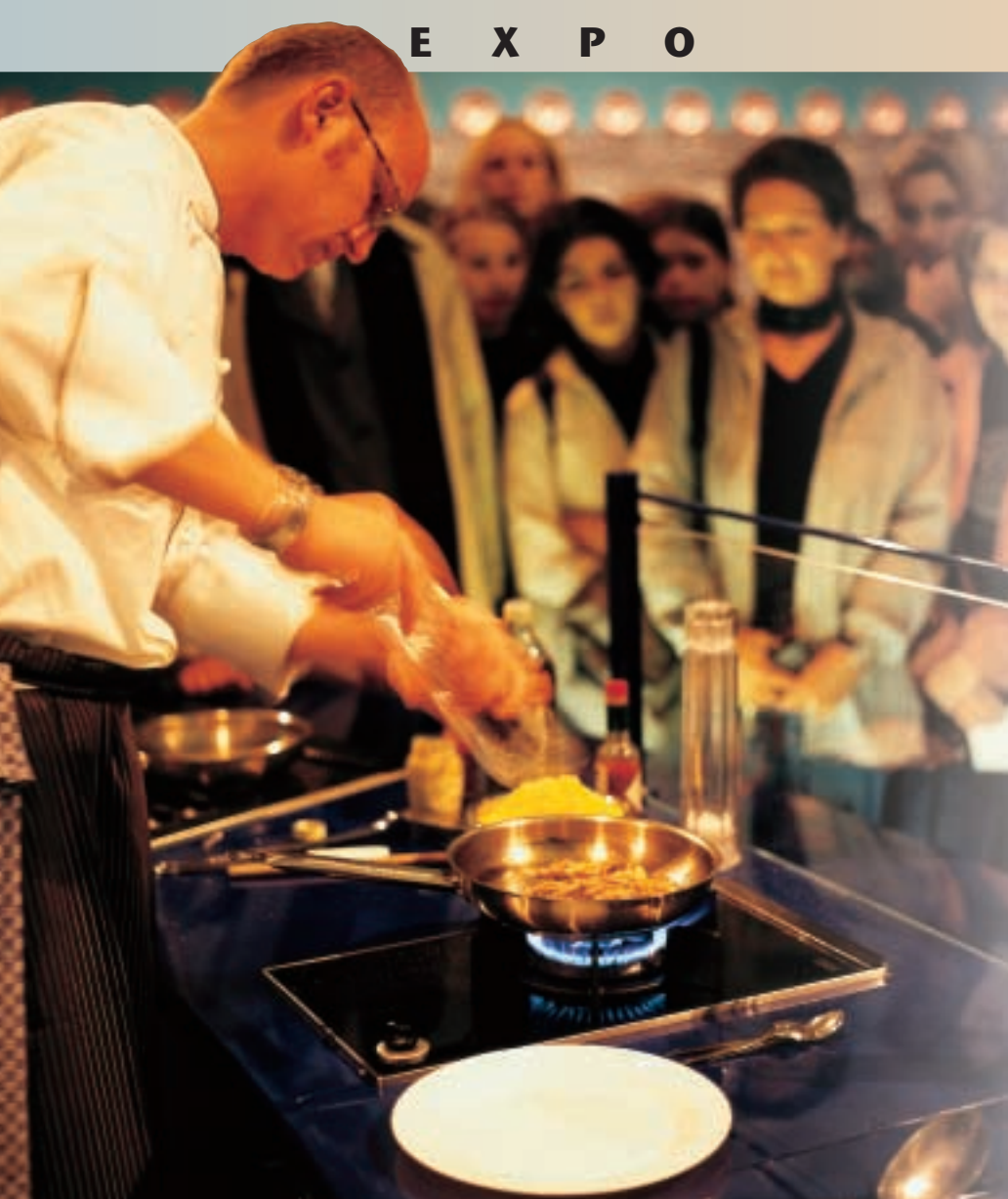
Publikums-Magnet auf der EXPO in Hannover: Die Insekten-Küche zum Zuschauen und Testen.