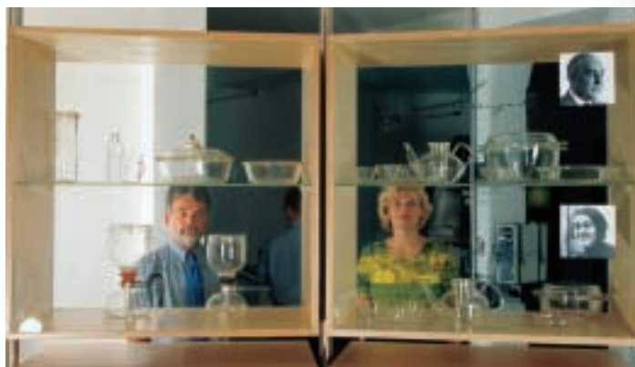
Begegnung mit der Vergangenheit: Jenaer Klassiker für den Haushalt, wie beispielsweise das hitzebeständige „Jenaer Glas“ Geschirr und die „Sintrax“ Kaffeemaschine.

Im Museum sind Produkte von Schott nicht nur in Form von Exponaten zu sehen. Sie werden auch in der Ausstellungstechnik eingesetzt: etwa entspiegelte Gläser „Mirogard“ für Vitrinen und Displaytafeln, eine neuentwickelte und patentierte Langfeldleuchte mit Glasrohrprofilen für die Grundbeleuchtung, Halogenlampenreflektoren für die Exponat- und faseroptische Komponenten für die Vitrinenbeleuchtung.