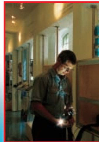
Informativ und interessant aufbereitet: die maschinellen Formgebungsverfahren für Spezialgläser.