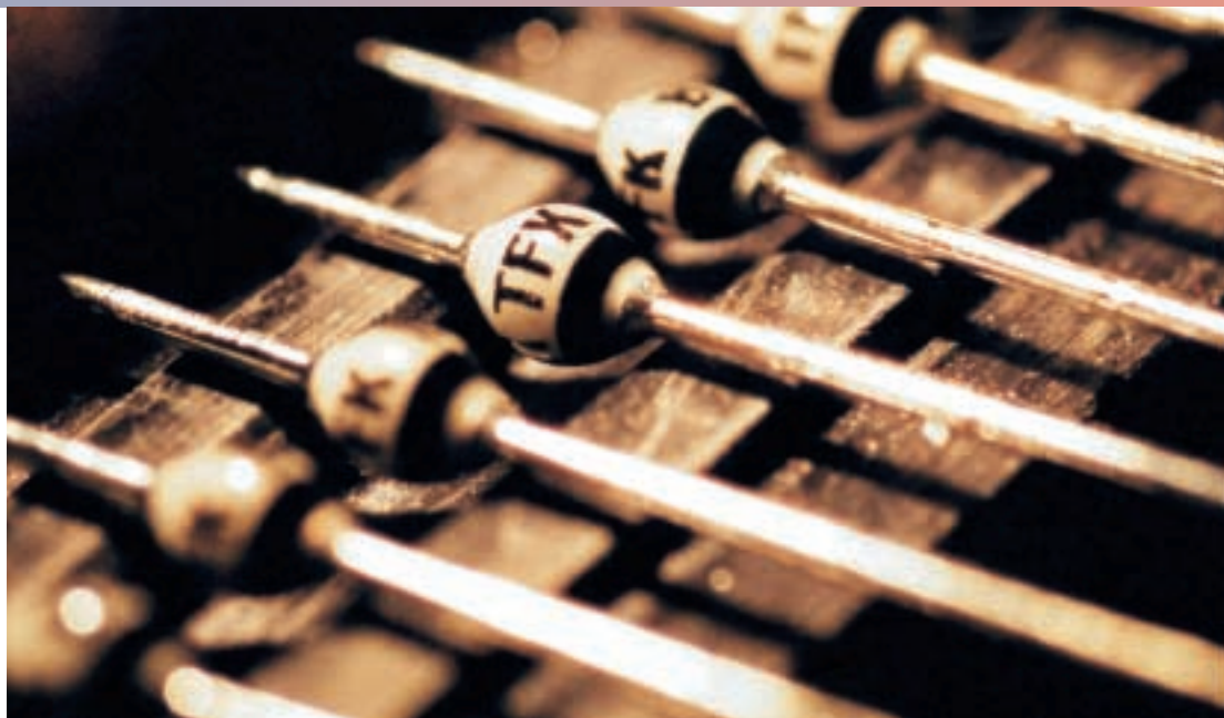
Gleichrichterdiode für Hochspannungs- und Hochtemperaturanwendungen.

Fertig zur Galvanisierung im Zinn-Bad: Gleichrichterdioden in einer Steckform.