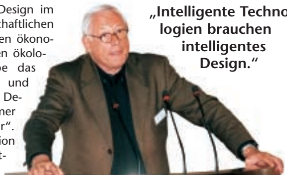
Prof. Dr. Dieter Rams, Designer

„Intelligente Technologien brauchen intelligentes Design.“