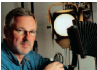
Erfasste Motive aus der Technologieentwicklung mit ästhetisch-künstlerischem Blick: Fotograf Werner Feldmann.