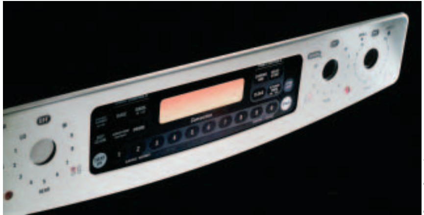
Diese Bedienfront kombiniert dekoriertes Glas, Touchsensorik und Edelstahl – alles aus einer Hand.