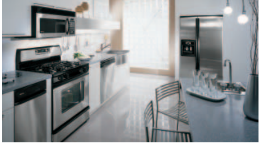
Edelstahlküchen liegen voll im Trend und erfreuen sich wachsender Beliebtheit.

Durch Berührung der hinterleuchteten elektronischen Berührungssensoren passt man die Temperatur in der Kühlschrankschublade auf Gemüse, Obst oder Fleisch an.