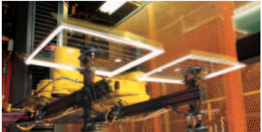
Vollautomatisch auf hohem Fertigungsniveau produzieren Automaten umspritzte Einlegeböden für Kühlmöbel.