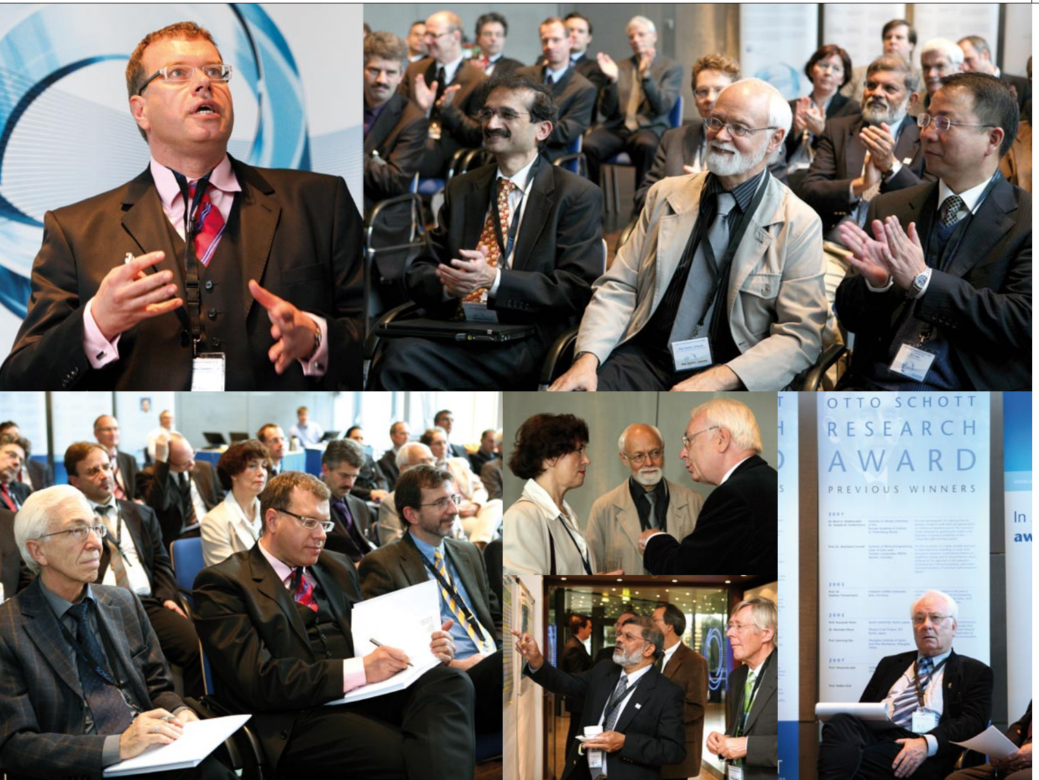
Highly distinguished glass researchers met at the German headquarters of SCHOTT in Mainz to attend the 10th presentation of the Otto Schott Research Award. The accompanying symposium featured outstanding expert presentations – and offered an optimistic outlook on the glasses and materials of the future.