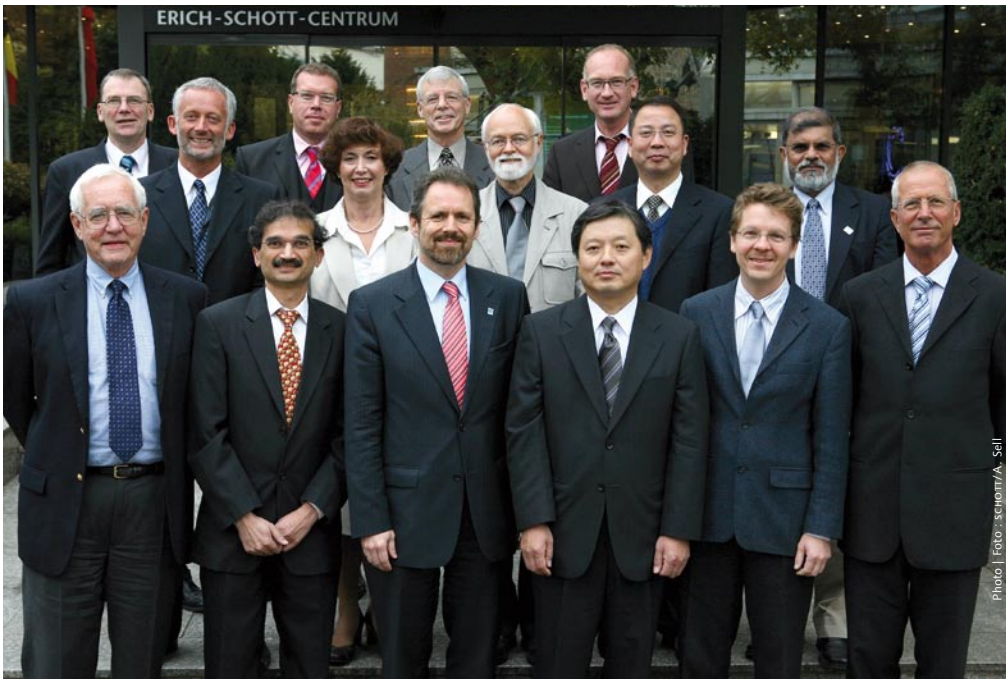
Many former award winners also took part in the presentation of the 10th Otto Schott Research Award (from left to right):

An der Verleihung des 10. Otto-Schott-Forschungspreises nahmen auch viele frühere Preisträger teil (v. links n. rechts):