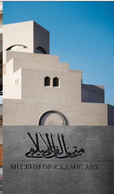
In the central hall of the museum that is flooded with light, two curved gala stairways lead into the second floor. The main building (right) fascinates with its sharp geometric lines.