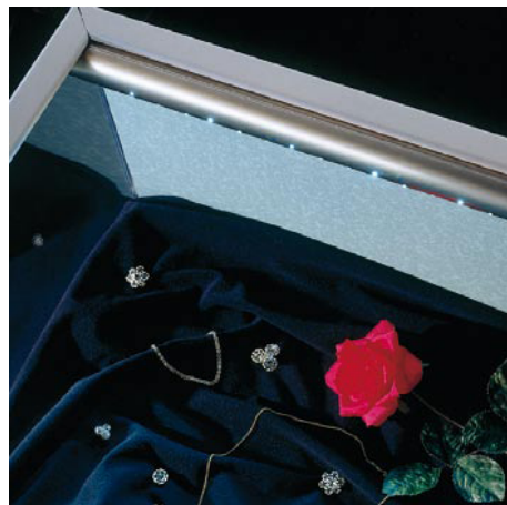
Regleta de luz SCHOTT Spectra™ de 35mm integrada en el canto lateral de una vitrina de mesa

No es necesario abrir la vitrina - dejando expuesto su valioso contenido - para reemplazar la lámpara.