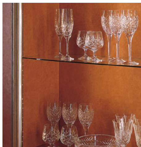
Regleta de luz SCHOTT Spectra™ de 35mm integrada en los laterales de una vitrina