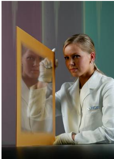
Bild Nr. 22994: Bleifreie Dekorationsfarben für „Robax“: Mehr Farbe für Öfen und Kamine mit „Robax“ Glaskeramik von SCHOTT durch die Erweiterung seiner Farbpalette.