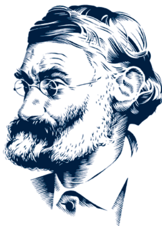
(1840 - 1905) Empresario y reformador social, ideólogo y creador de la Fundación Carl Zeiss. Empreendedor e reformador social, iniciador e fundador da Fundação Carl Zeiss.