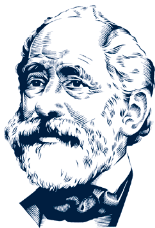
CARL ZEISS (1816 - 1888) Óptico y mecánico de precisión. Fundador de la actual Carl Zeiss AG. Mecânico óptico e de precisão. Fundador da atual Carl Zeiss AG.