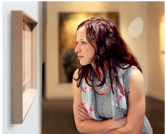
SCHOTT MIROGARD® DARO permet un encadrement pictural sur lequel les traces de doigt et la saleté n'ont pas leur place.

mais aussi l'excellente protection du traitement DARO contre la saleté. Ce sont toutes les caractéristiques qui ont la plus grande importance pour les musées, les galeries d'art, expositions etc.