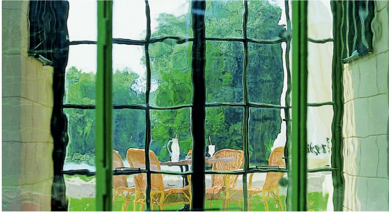
Orangerie im Schloss Schwerin: Mit RESTOVER® blieb der historische Charakter der Fenster erhalten.