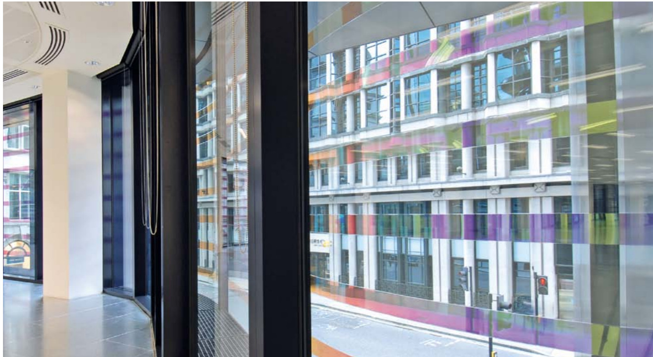
Faszinierender Ausblick: NARIMA® im Bürohaus „60 Threadneedle Street“, London Architektur: Eric Parry Architects