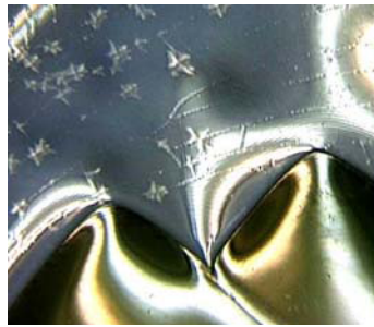
Risse und Platzer nach der Verschmelzung

Zur Vermeidung der beschriebenen Auswirkungen haben wir folgende Praxistipps: